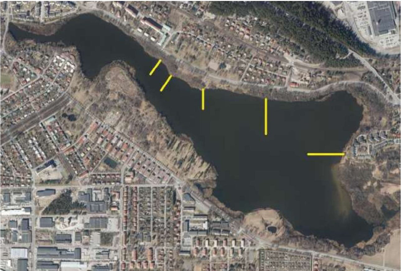
Kartta 1. Luontoarvojen puolesta hyväksytyt rysäpaikat. Käytettävissä oleva rysämäärä on asettava näihin sijainteihin esim. peräkkäin. Kolmessa läntisimmässä pyyntikohdassa rysän kokonaispituus voi olla korkeintaan 80 m/paikka. Kahdessa itäisessä pyyntikohdassa max. 200 m/paikka. Ortokuva: © Maanmittauslaitos 2 / 2021